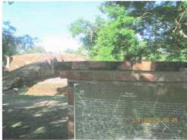
โบราณสถาน หมายเลข ๓๘ วัดโขลงสุวรรณคีรี ในความดูแลของกรมศิลปากร กำหนดเขตที่ดินเฉพาะเขตโบราณสถาน (ขึ้นทะเบียน)