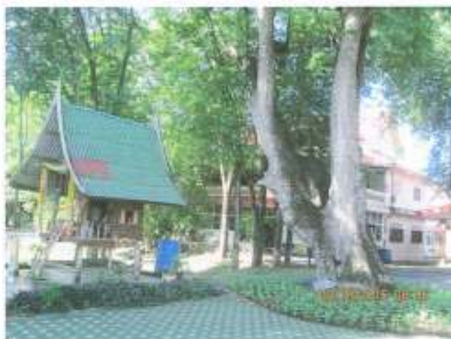
ศาลเจ้าที่ และต้นมะขามขนาดใหญ่ อายุกว่า ๑๐๐ ปี ในวัดโขลงสุวรรณคีรี ประชาชนศรัทธากราบไหว้ อยู่มาาก่อนตั้งวัด