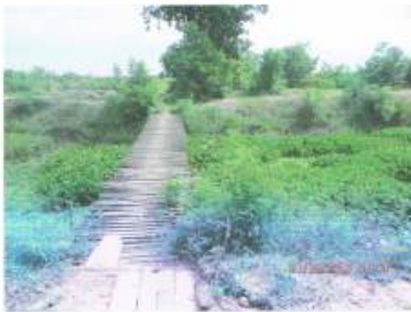
สะพานข้ามคลอง ของหมู่บ้าน