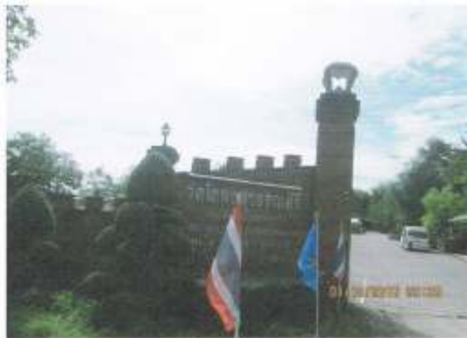
วัดโขลงสุวรรณคีรี

(๔) สถานที่สำคัญ ที่ตั้งสัมพันธ์กับประชาชนในหมู่บ้าน