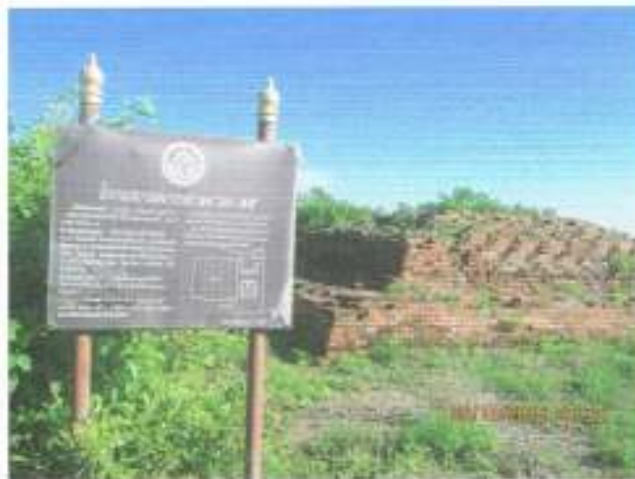
โบราณสถาน หมายเลข ๒๔ และ ๒๕ บ้านสระโบสถ์ ในความดูแลของกรมศิลปากร กำหนดเขตที่ดินเฉพาะเขตโบราณสถาน (ขึ้นทะเบียน)