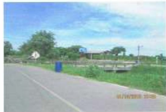
สะพานข้ามคลอง คอนกรีตเสริมเหล็ก ในความดูแลของ ทางราชการ