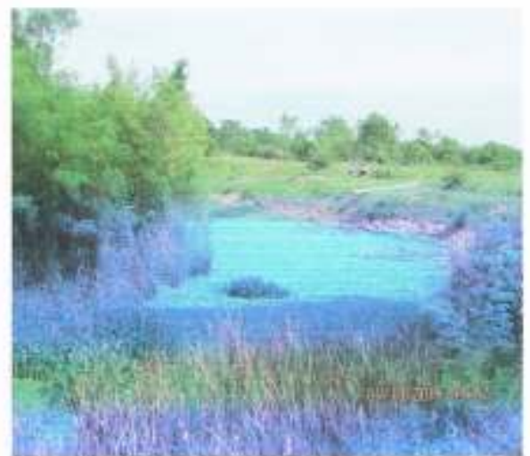
คลองชลประทาน ขนาดใหญ่ ตั้งแต่ หมู่ที่ ๑๒ ผ่าน หมู่ที่ ๖ หมู่ที่ ๔ ลงมาที่ หมู่ที่ ๓ ในความดูแลของ กรมชลประทาน